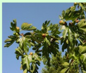
انجیر نام علمی: Ficus carica خانواده: Moraceae

ازدیاد: از طریق کاشت بذر در فضای باز در پاییز و یا پیوند زدن در زمستان امکان پذیر است.