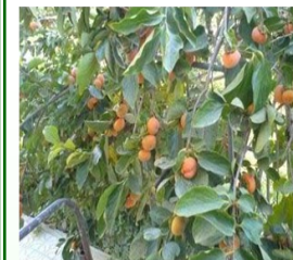
خرمالو نام علمی: Diospyros kaki خانواده: Ebenaceae

ازدیاد: از طریق ریشه دار کردن قلمه های خشبی در اواخر پاییز امکان پذیر است.