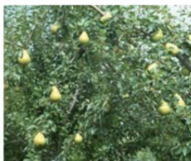
کلابی نام علمی: Pyrus communis خانواده: Rosaceae

ازدیاد: از طریق کاشت بذر در پاییز و یا قلمه زنی در نیمه زمستان امکان پذیر می باشد.