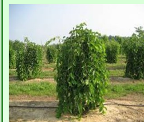
توت نام علمی: Morus alba خانواده: Moraceae

ازدیاد: از طریق کاشت بذر در تابستان و یا پیوند روی پایه نهال خرمندی (خرمالوی نرک) امکان پذیر است . پس از کاشت نهال یک نوبت آبیاری شود و تا زمان ظهور جوانه های جدید آبیاری نگردد.