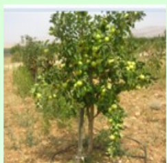
سیب نام علمی: Malus pumila خانواده: Rosaceae

ازدیاد: از طریق قلمه ساقه در اواخر تابستان و کشت پاجوش در دوره خواب گیاه و یا اوایل فصل رشد امکان پذیر است.