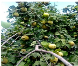
به نام علمی: Cydonia oblonga خانواده: Rosaceae

درخت کوچکی است به ارتفاع حداکثر ۵ متر، پوست میوه های رسیده در ارقام مختلف دارای رنگ زرد و یا زرد مایل به طلایی می باشد. از ۵-۴ سالگی می تواند میوه تولید کند.